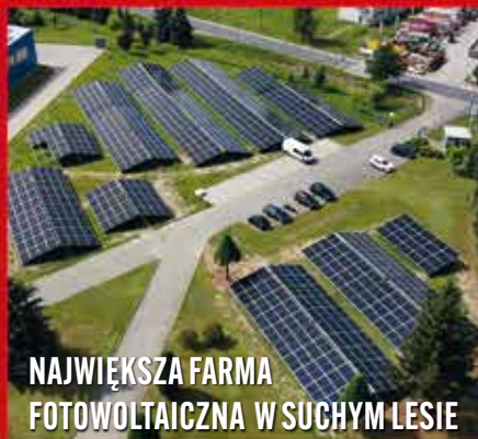
NAJWIĘKSZA FARMA FOTOWOLTAICZNA W SUCHYM LESIE