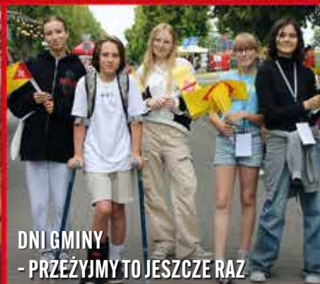
DNI GMINY - PRZEŻYJMY TO JESZCZE RAZ