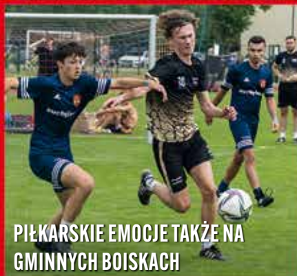
PIŁKARSKIE EMOCJE TAKŻE NA GMINNYCH BOISKACH