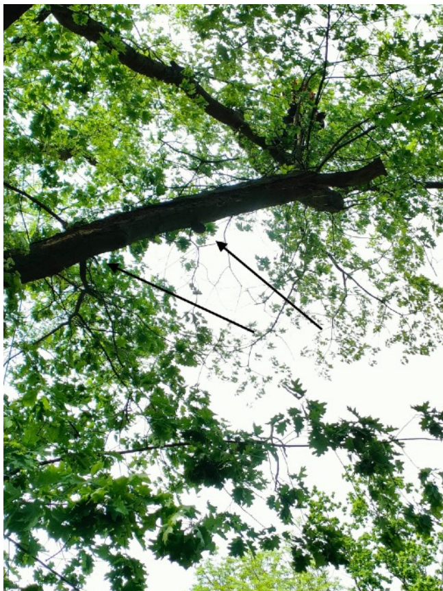
Fot. 3 Konar posiadający owocniki grzybów, znaczny rozkład wewnętrzny i martwicę