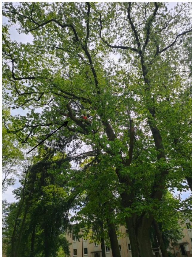
Fot. 4 Redukowany konar podczas prac